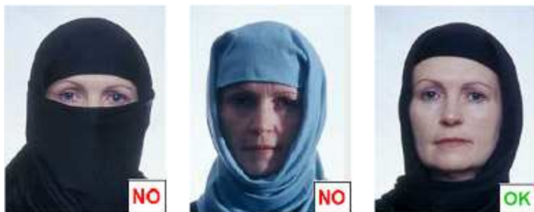
figura 12 bis

Volto coperto Parte del volto coperto - ombre sul volto